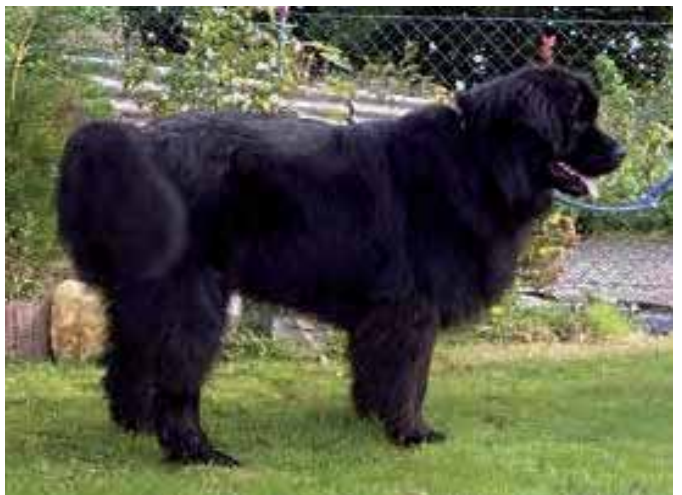
Jugend-Clubsieger: Orlando vom Riffersbach